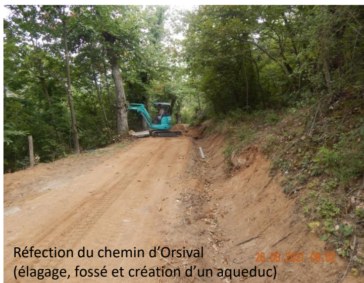
Réfection du chemin d'Orsival (élagage, fossé et création d'un aqueduc)