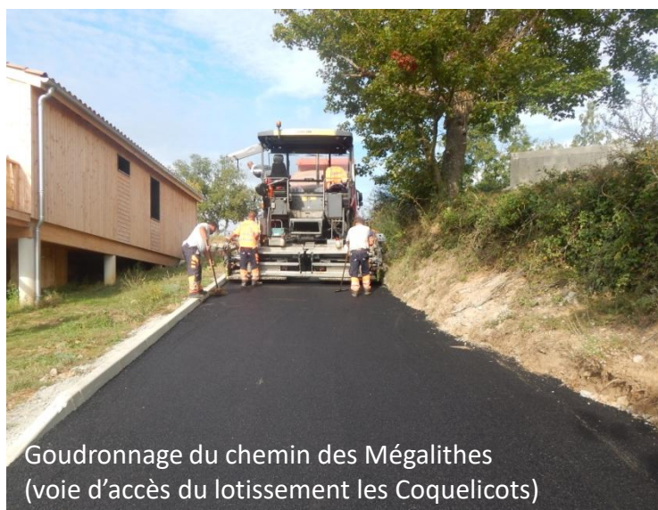
Goudronnage du chemin des Mégalithes (voie d'accès du lotissement les Coquelicots)