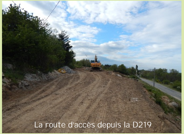
La route d'accès depuis la D219