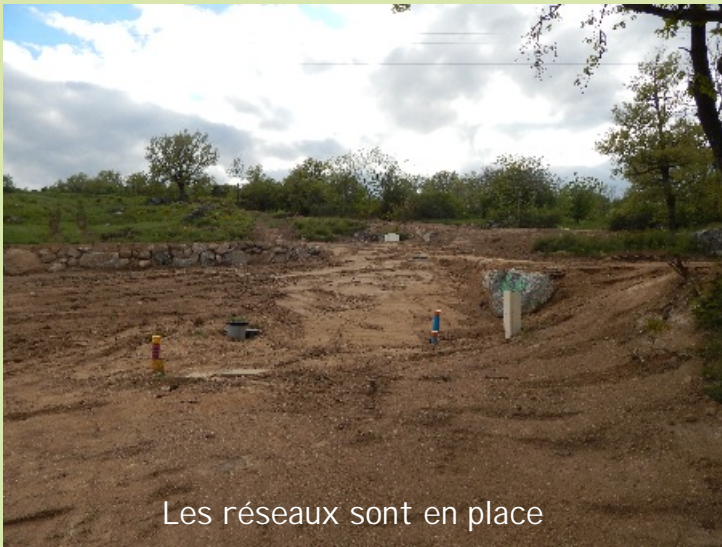
Les réseaux sont en place