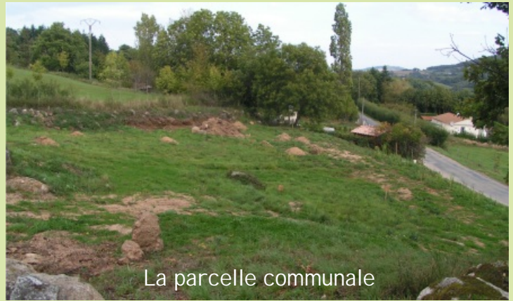
La parcelle communale