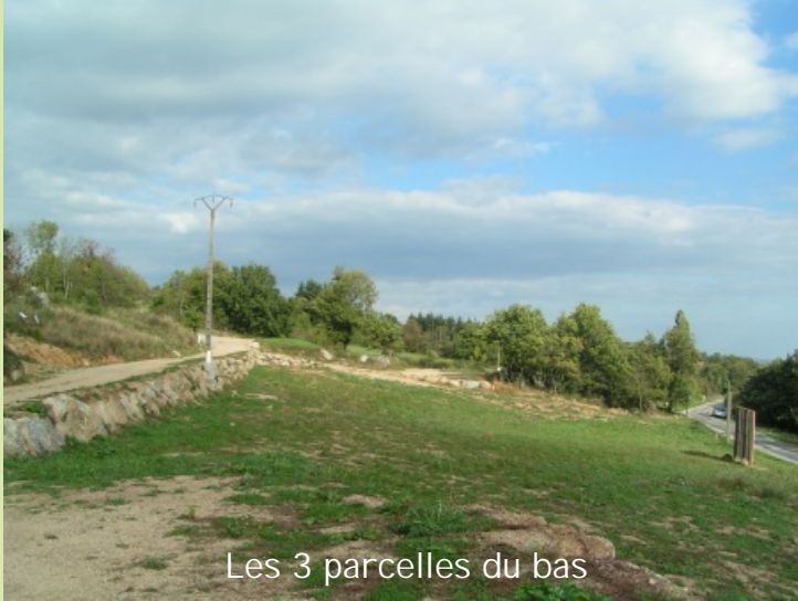
Les 3 parcelles du bas