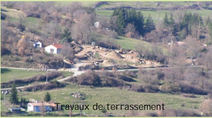
Travaux de terrassement