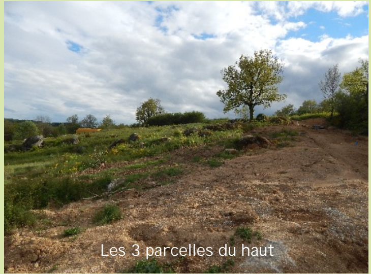
Les 3 parcelles du haut