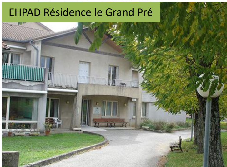
EHPAD Résidence le Grand Pré

► Dans les années quatre-vingts, les conseils municipaux d'Alboussière, Boffres, Saint-Sylvestre et Champis constituent un CIAS (Centre Intercommunal d'Action Sociale).