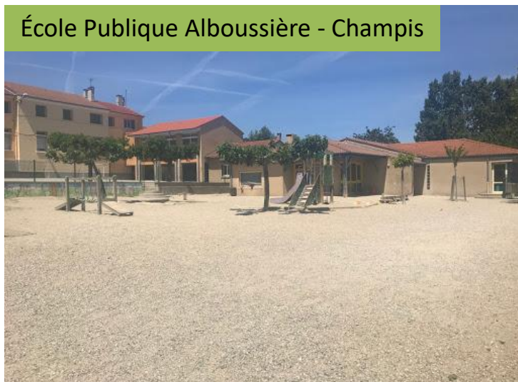
École Publique Alboussière - Champis

► En 1974, l'école de Champis a fermé et les élèves champinois ont naturellement été scolarisés à Alboussière.