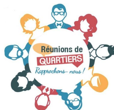
Également à Garnier et la Bâtie