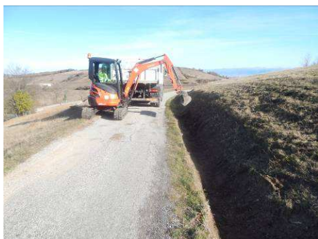
Chemin de Rosières