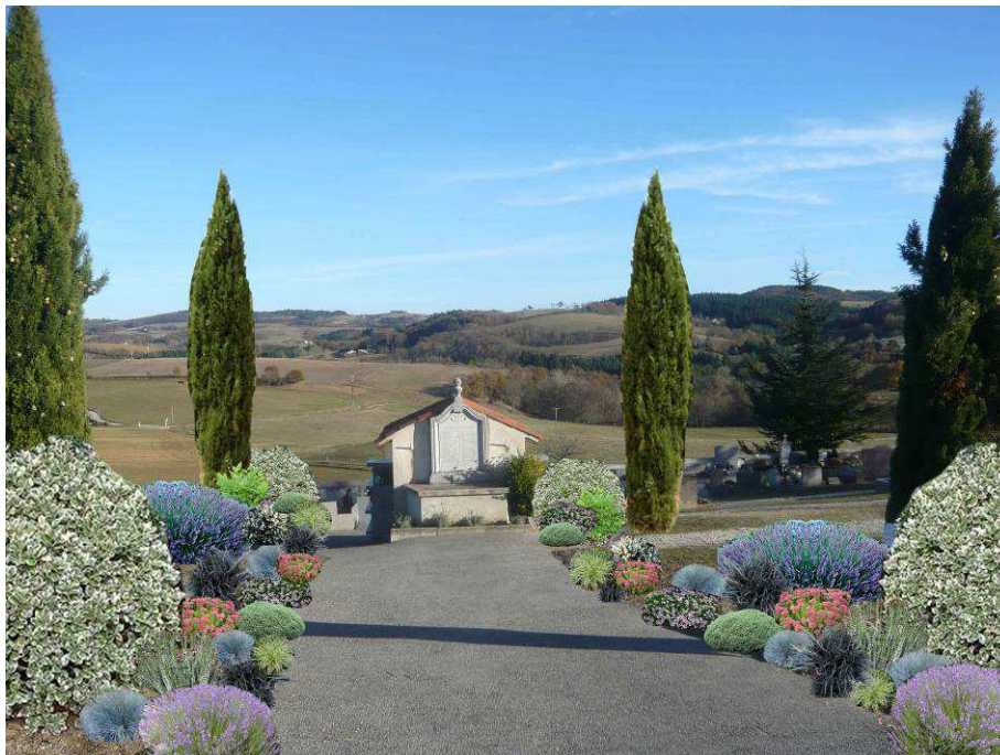
Projet de fleurissement au cimetière