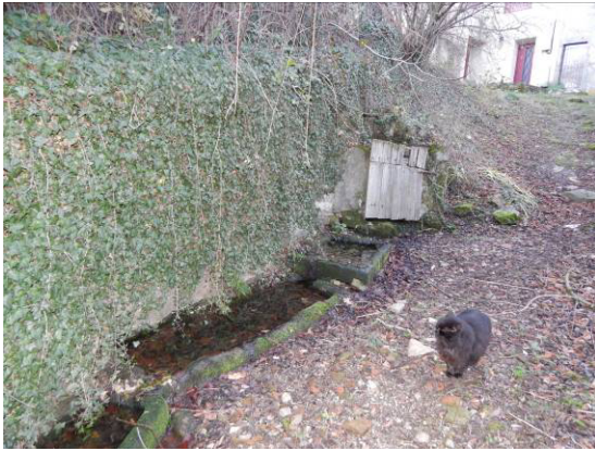
❖ La fontaine communale de THEOLIER et ses bassins en pierre