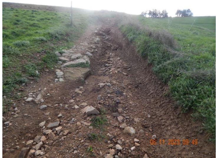
Chemin rural de Rosières

Installation en cours des barrières à neige secteur le Fringuet, route des Crêtes par les employés communaux.