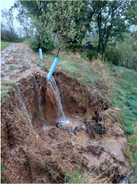
Chemin rural Napoléon allant de Vinard à Garnier

A la suite des pluies torrentielles et des vents violents, certains chemins ruraux itinéraires de randonnée ont été endommagés, des travaux seront effectués pas les agents de la CCRC prochainement.