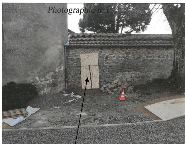
Entrée des WC publics